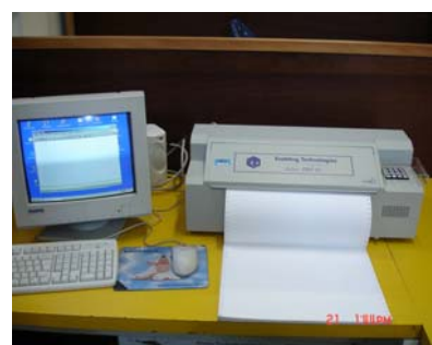
Figura 4 - Impressora Braille.