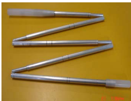
Figura 5 - Produção e Manutenção de Bengalas Articuláveis para Deficientes Visuais.