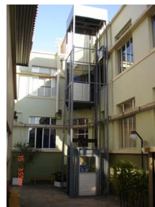
Figura 7 - Fabricação e Instalação de Elevadores para Cadeirantes nos Campi da UTFPR.