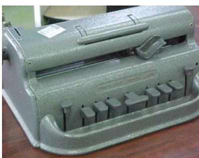
Figura 3 - Máquina de Escrever Braille.

As figuras 3 a 7 apresentam alguns equipamentos, adaptações e projetos desenvolvidos na UTFPR para atendimento aos Portadores de Necessidades Educacionais Especiais.