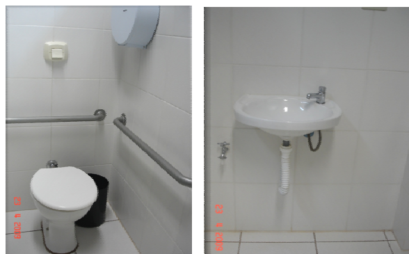
Figura 6 - Sanitário adaptado.